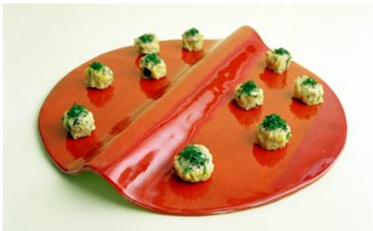
Tomovi specijaliteti: praseći medaljoni...